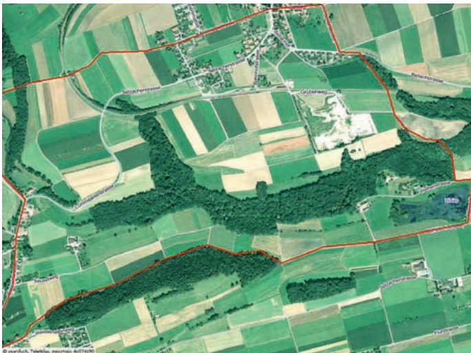
Luftbild des Bellacher-Weiher und seines Einzugsgebietes.